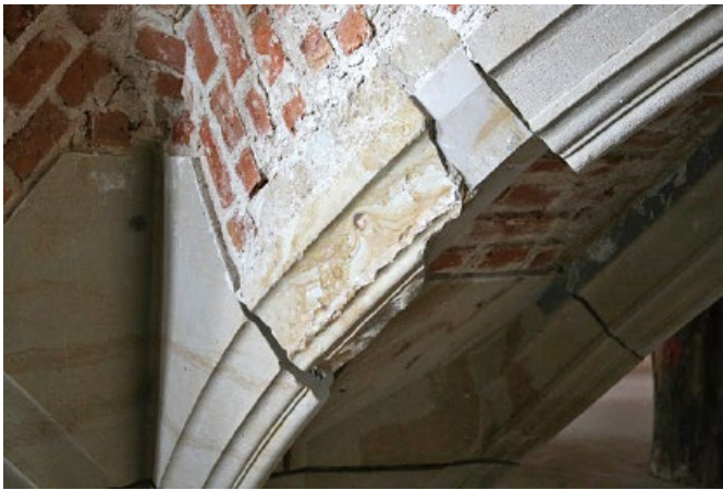
Bild 3. Rippenwerkstück aus Ausgrabungen, wurde im heutigen Rippenverlauf wieder mit eingesetzt