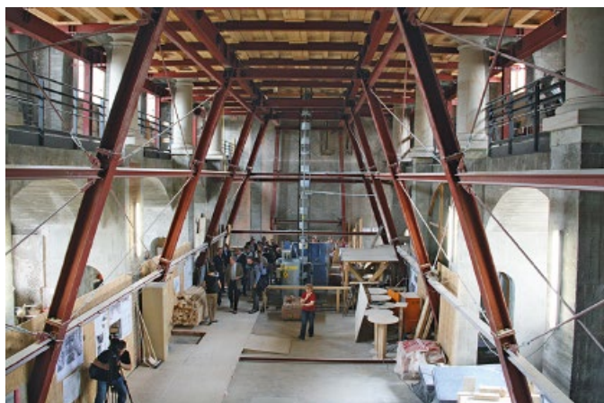
Bild 8. Arbeitsboden des Gewölbes auf Stahlgerüst in der Schlosskapelle