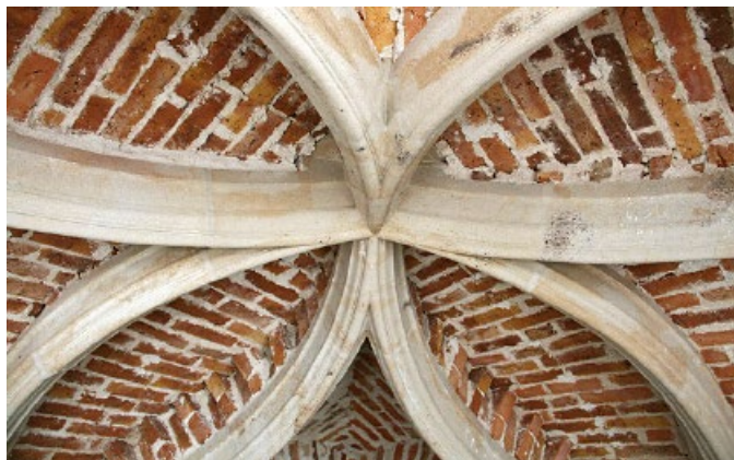
Bild 6. Mauerwerksverband in der Blütenblattfigur