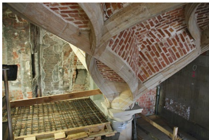
Bild 9. Detail Gewölbeanfänger auf Toskanischer Säule mit Abakusplatte

Nach Angaben des Sächsischen Staatsministeriums der Finanzen wurden in die Rekonstruktion des Schlingrippengewölbes 1,8 Mio. € investiert. Die Kapelle wird im Rohzustand belassen und im 3. Quartal 2013 an die Staatlichen Kunstsammlungen für öffentliche Nutzungen, insbesondere musikalische Veranstaltungen, übergeben.