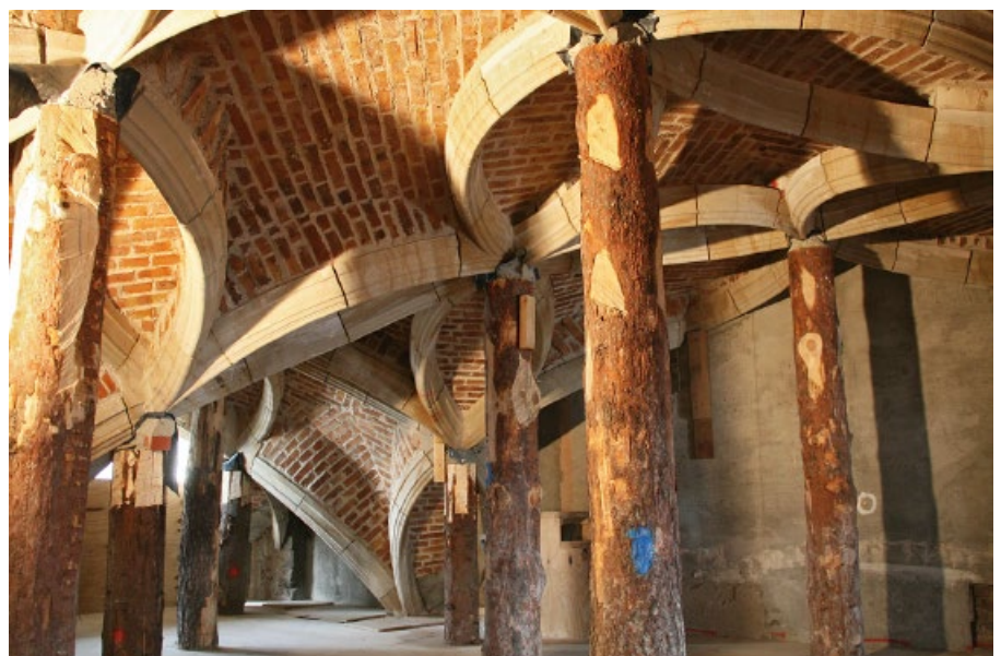
Bild 1. Untersicht Schlingrippengewölbe mit noch vereinzelt stehenden Baumstämmen des Lehrgerüsts

Basierend auf dem Figurationsentwurf, der die untere Rippenmittellinie im Verlauf des Grundrisses und der Bogenausragung im Aufriss vorgab, wurde zur Findung der Rippenkörpermodellierung eine steintechnische Werkplanung am 3D-Computermodell durchgeführt, die dahingehend sicher