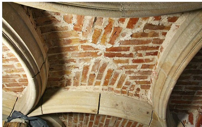
Bild 7. Mauerwerksverband in der Rautenfigur